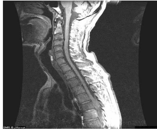
Фиг.4. MRI на гръбначния стълб