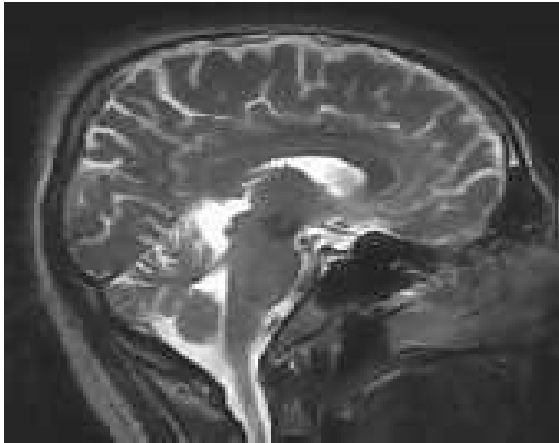
Фиг.3. MRI на човешки череп

Свръхпроводимостта се постига чрез постоянно охлаждане на намотките с течен хелий. Допълнителни магнитни полета, значително по-слаби от основното, се създават от три независими намотки. Захранването на основната намотка и отвеждането от нея на ЯМР сигналите се управлява от компютър, с помощта на който се формира и образът. Образът се представя върху флуоресциращия екран на монитора, откъдето се фотографира. На пациентите не се причиняват увреждания. Единственият проблем е, че се използва течен хелий за съхраняването на който са нужни много средства. MRI образи на човешки череп и гръбначен стълб са представени на фиг.3 и фиг.4 , съответно.