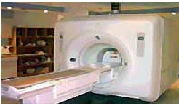
Фиг.2. MRI прибор

Силните магнити, които са нужни за тези прибори са перфектно приложение на свръхпроводниците. По време на изследването пациентът се намира във вътрешността на кръгла камера (фиг.2). Около камерата се създава силно магнитно поле от свръхпроводящи електромагнити, което ориентира водородните ядра в тъканите на пациента по посока на линиите на магнитното поле. Магнитът, който създава основното постоянно магнитно поле, представлява свръхпроводяща система от намотки и криостат. Магнитната индукция на това хомогенно поле е 0.5, 1.0 или 1.5 Т при различните томографи [6].